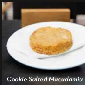
Cookie Salted Macadamia